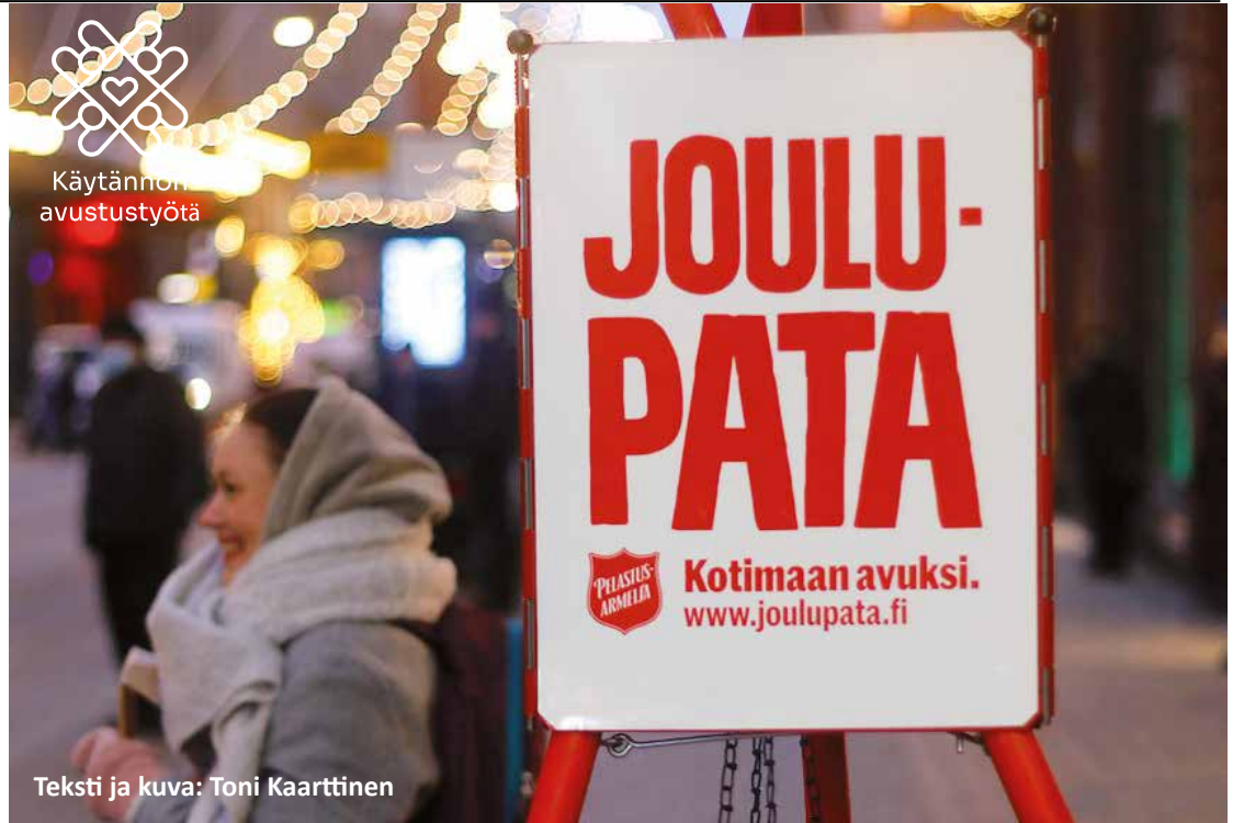
Teksti ja kuva: Toni Kaartinen

Auta Pelastusarmeijaa auttamaan: joulupata.fi, MobilePay 45011, tekstiviesti "PATA" (10 €) tai "PATA20" (20 €) numeroon 16499. Pelastusarmeijan kirpputori Kouvolankatu 21, jonne tavaralahjoitukset toivotaan.