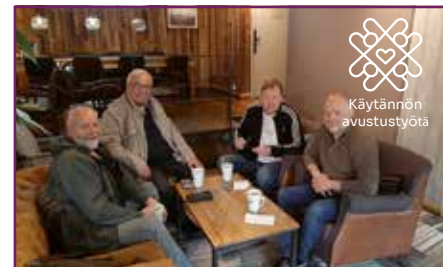
Monet yksityiset järjestöt ja ihmiset auttavat toisia pyyteettömästi. SIVUT 10-12