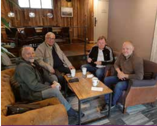
Teksti ja kuvat: Ismo Valkoniemi