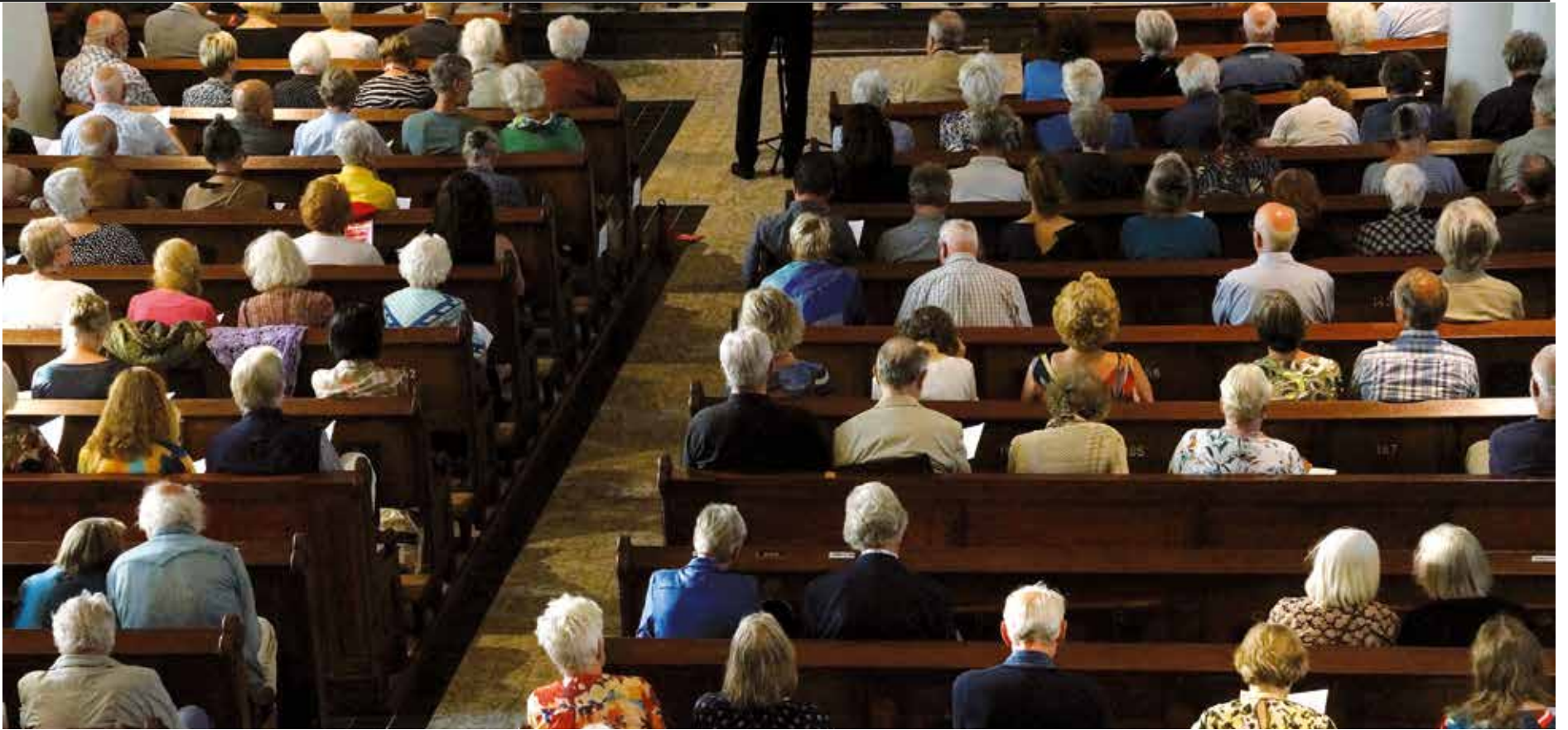
Teksti ja kuva: Jukka Tuunanen