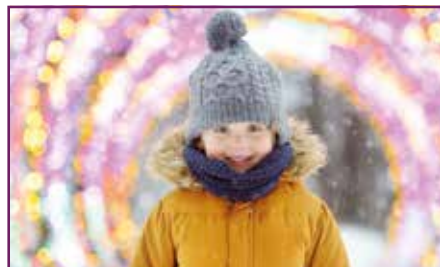
Ilon ja valon juhla SIVU 6